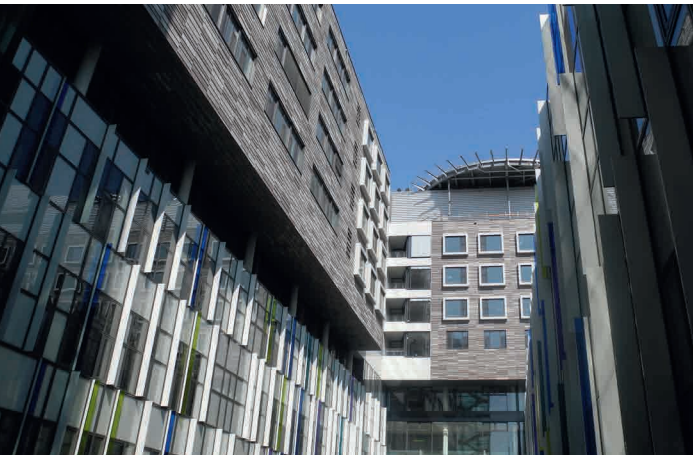
Innenhof/BTGr 40 und Bettentrakte