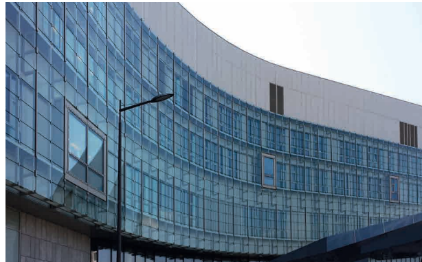
Ansicht Doppelfassade - Venus/Haupteingang

Das Krankenhaus Nord des Wiener Krankenanstaltenverbundes (KAV) entstand am linken Donauufer. Hier wird das rund 170.000 m 2 große Industriegebiet in den kommenden Jahren in ein hochwertiges Gesundheitsareal umgewandelt werden. Das Bauwerk wurde durch hohen Tageslichtanteil und lichtdurchflutete Atrien als modernes High-Tech-Spital mit Wohlfühlcharakter konzipiert. Somit wird das Krankenhaus Nord zu einem wichtigen Eckpfeiler der Wiener Spitallandschaft. Für Dobler Metallbau bestand die Herausforderung im Projektumfang und der Vielfalt an unterschiedlichsten Fassadenkonstruktionen.